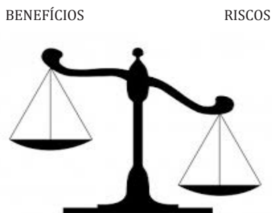
Figura 1: Princípio da Justificativa e a análise de riscos x benefícios.

A Figura 1 expressa o princípio da justificativa, baseado na premissa de que os benefícios advindos com a irradiação devam ser mais significativos que os riscos causados ao indivíduo.