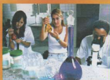
Laboratório de Ciências da Saúde