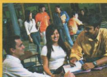
Centro de Convivência

INSCRIÇÕES ABERTAS: 3215.2917 | 3215.2918