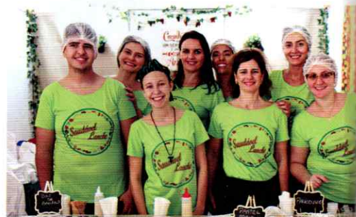
Grupo do projeto Saudável Lanche e uma pitada de inovação na culinária tradicional