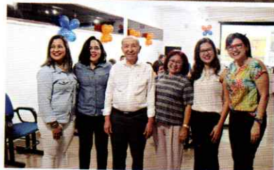
Evento teve egressas como palestrantes