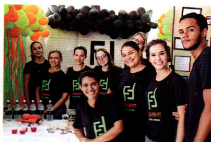
O grupo do projeto Flavor Fit aposta na água saborizada para ajudar na dieta