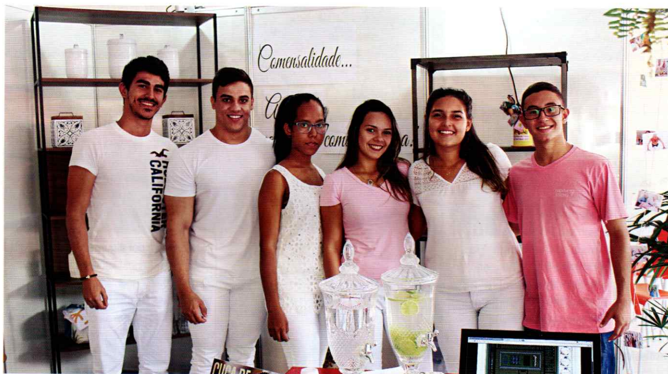
O projeto Doce Lar mostra que é possível pratos saborosos com produtos da culinária caseira

A FENUT, feira do curso de Nutrição, tem o objetivo de expor trabalhos interdisciplinares e com temas de relevância para a formação profissional. Este ano, a XIV Feira de Nutrição teve como tema "Nutrição Sustentável e sem Modismos. Os alimentos orgânicos foram os principais elementos dos pratos apresentados.