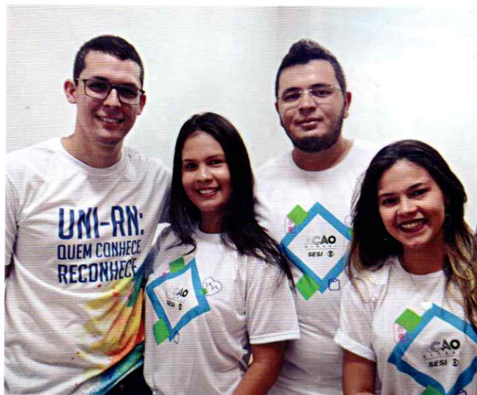
Alunos, professores e funcionários se envolveram na ação