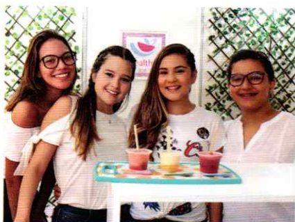
Alunas do projeto Heathy Ice e uma receita de gelados para comer sem culpa