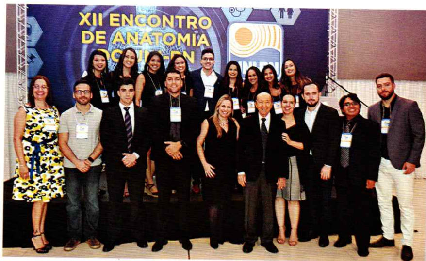
O Encontro de Anatomia é um dos eventos mais tradicionais do UNI-RN na área da saúde