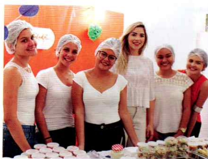
O Fast Salada tem como proposta uma variedade de saladas à moda do cliente