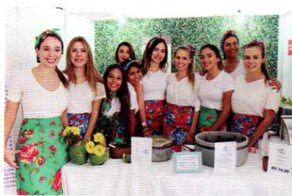
Proposta do projeto Vida Foods é o uso de produtos orgânicos em pratos caseiros