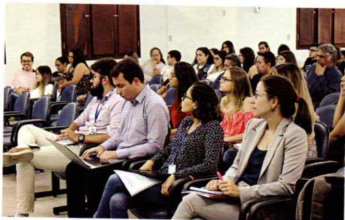
Evento busca aproximar alunos e profissionais para a troca de conhecimentos

Um dos grandes desafios de arquitetos e urbanistas, hoje, é criar projetos de qualidade, funcionalidade e projetar a sustentabilidade em cada trabalho. A II Semana de Arquitetura e Urbanismo do UNI-RN tem buscado aproximar o aluno – futuros profissionais – dessa nova realidade, por meio de debates, circuito de palestras, oficinas, visitas