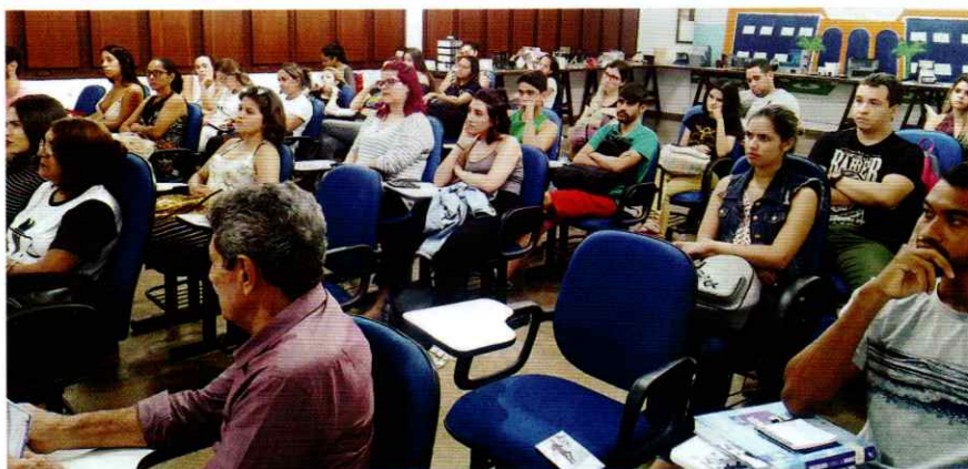
Palestras abordam temas relevantes para os alunos da graduação e pós-graduação