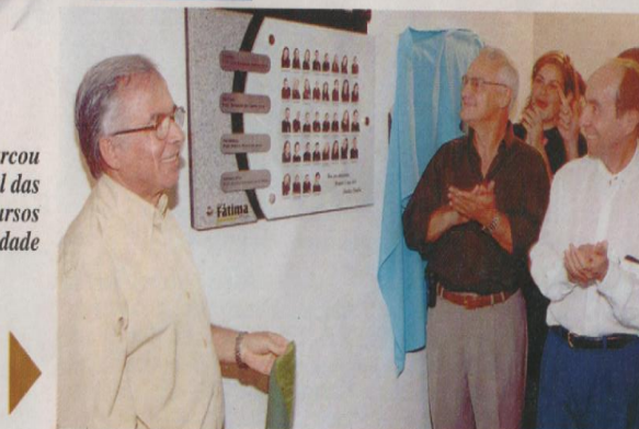
Emoção marcou o registro oficial das placas dos cursos pioneiros na faculdade