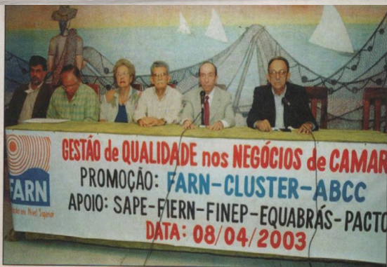
Um registro da solenidade de abertura do Seminário