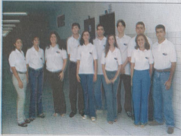
Alunos da Empresa Júnior já iniciaram suas atividades. Contato: fone 215 2940

Empresa Júnior é uma associação civil sem fins lucrativos totalmente gerida por estudantes de graduação. O único