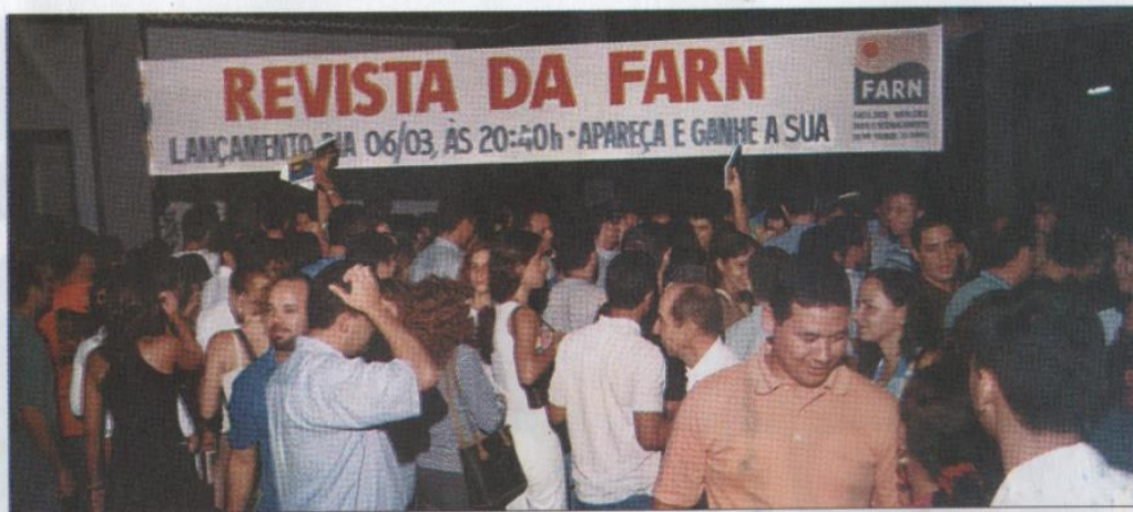
A COMUNIDADE ACADÊMICA FOI MOBILIZADA PARA O LANÇAMENTO DA REVISTA CIENTÍFICA QUE TEVE DISTRIBUIÇÃO GRATUITA