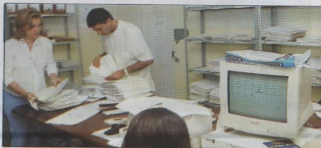
Estágio é um bom começo para profissionalização

Os requisitos básicos exigidos para concorrer a uma vaga de estágio são: ser matriculado regularmente na faculdade e ter assiduidade. Esses estudantes são absorvidos por empresas privadas, órgãos da adminis-